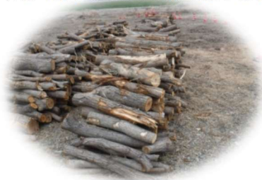
配布予定の伐採木