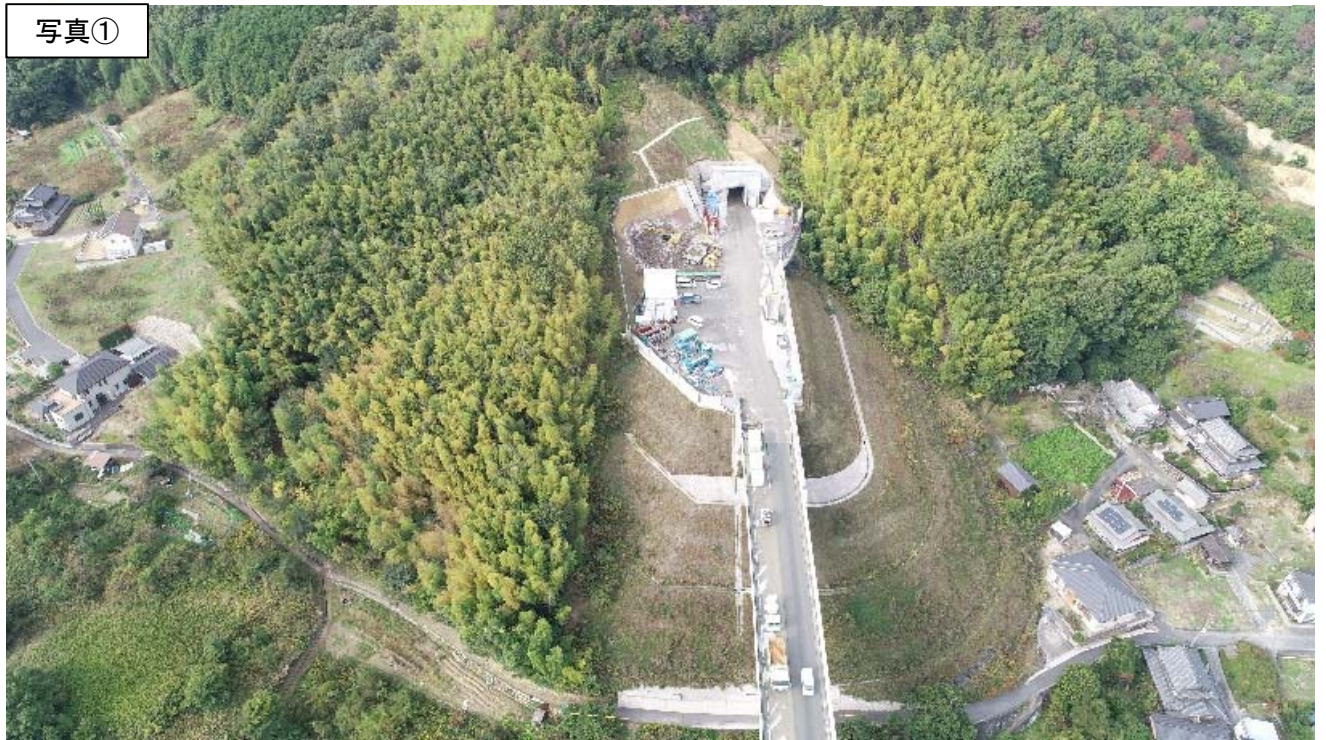
《起点側坑口付近空撮 R2.10.28》