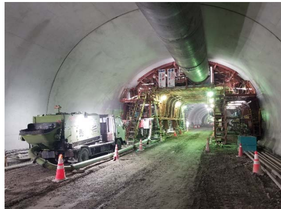
《トンネル坑内：覆工作業の様子》