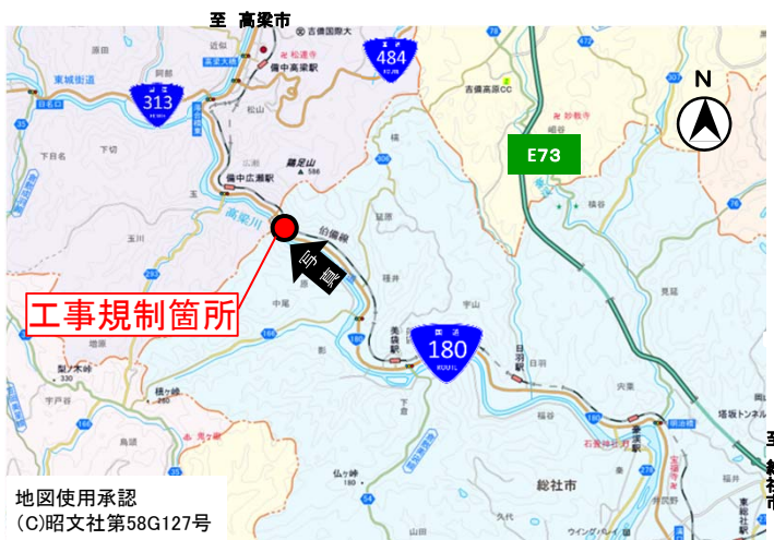
工事規制実施位置