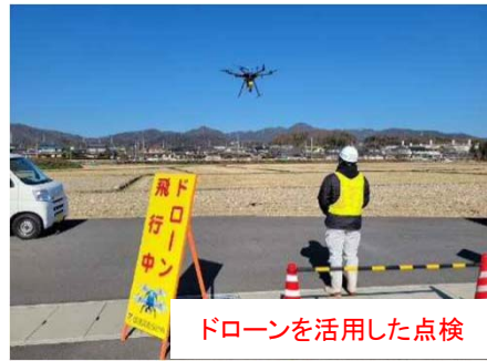
ドローンを活用した点検