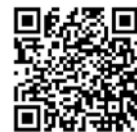
スマート通勤おかやまHP

http://www.cgr.mlit.go.jp/okakoku/mm/index.html