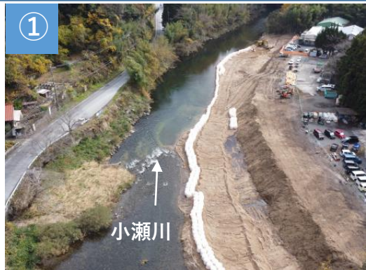
小川津地区堤防施工状況（令和4年12月撮影）