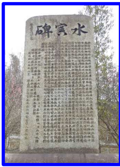
自然災害伝承碑 (水害碑：広島県坂町)