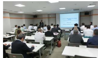
勉強会の開催状況