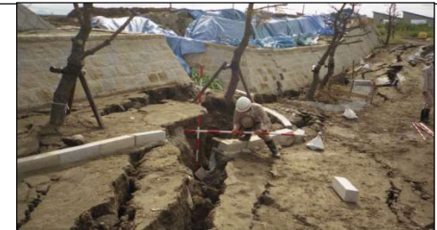
被害事例(鳥取県境港市)(H12.10.6 鳥取県西部地震)