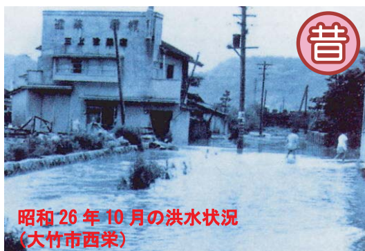
昭和26年10月の洪水状況 (大竹市西栄)

「河川整備計画」を作成するうえでは、昔はどうだったのか？ 今がどうなのか？ これから先どうすべきか？ について考えることが大切だと思います。みなさんも“小瀬川のこれから”について一緒に考えてみませんか？