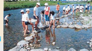
中津原水辺の楽校の利用状況

※水辺の楽校・・・国土交通省で平成8年度より行っている、水辺での活動を安全かつ充実したものとするための河川整備