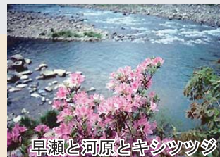
早瀬と河原とキシツツツ