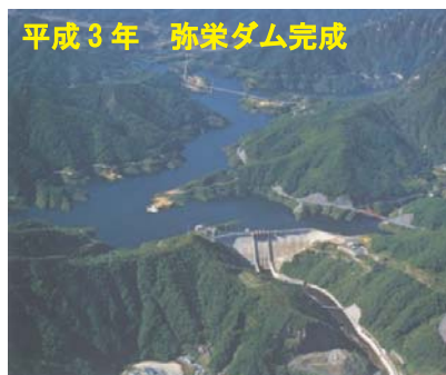
平成3年 弥栄ダム完成