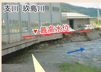
平成17年9月洪水では、水かさが増して、川岸が削られる被害が発生!