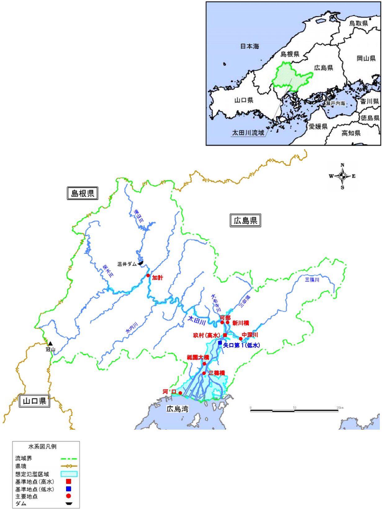
(参考図) 太田川水系図