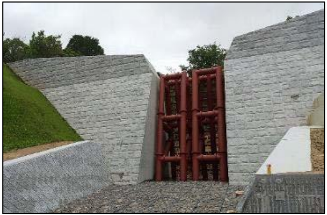
山本1号砂防堰堤(広島市安佐南区)