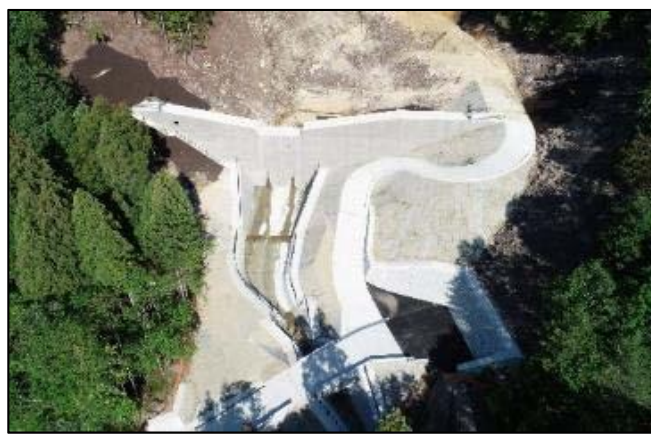
城北4号砂防堰堤(広島市安佐北区)