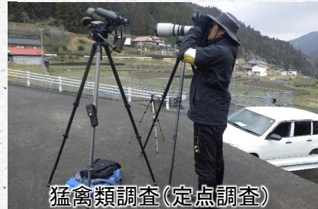
猛禽類調査(定点調査)