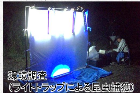
環境調査 (ライトトラップによる昆虫捕獲)