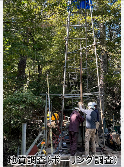
地質調査(ボーリング調査)