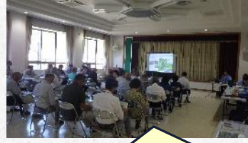
調査報告会の様子

平素より国土交通行政にご理解とご協力を賜り、厚く御礼申し上げます。 令和8年5月29日,30日に安芸太田町役場にて現地調査報告会を行い、 昨年度の調査結果や今後の調査予定などを説明させていただきました。 令和8年度におきましても、安全第一で調査を実施してまいりますので、引 き続きよろしくお祈いします。