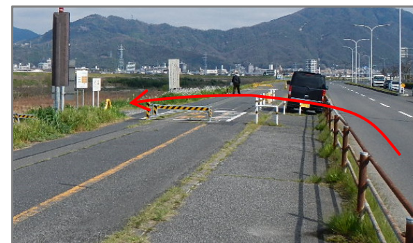
小田第二駐車場入り口 (1班PM乗車位置、2班AM降車位置)