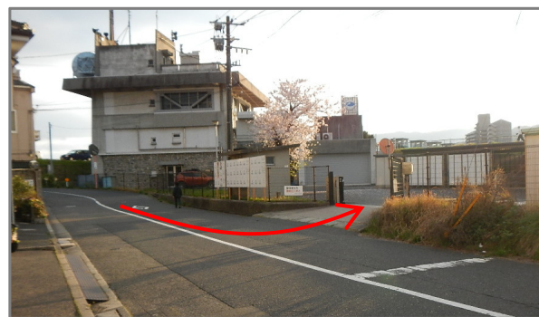
大芝出張所 (出発式会場) ※駐車は下側の駐車場へお願い致します。