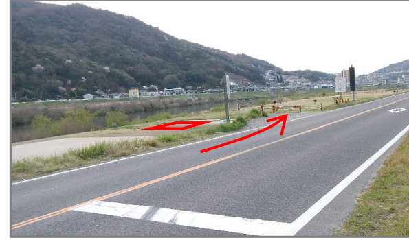
太田川10.0k右岸 (2, 3班乗車終了位置)