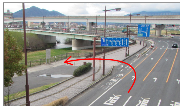
太田川6.8k左岸 (1班AM, PM降車位置)