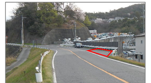
太田川13.0k左岸 (2班AM乗車位置) ※乗降時の停車のみで駐車はできません。