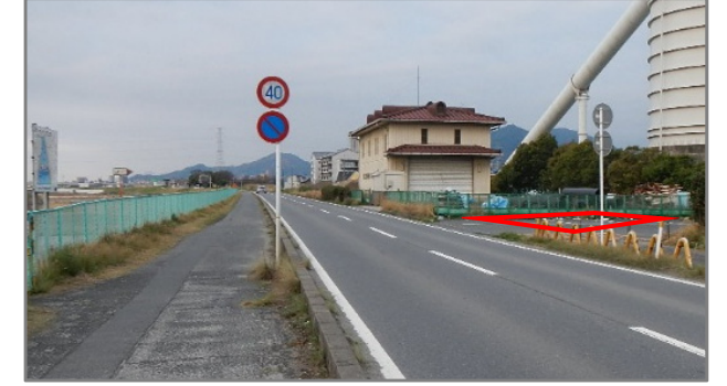
太田川13.0k右岸 (2班PM降車位置)