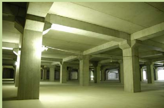
雨水貯留地内部の様子