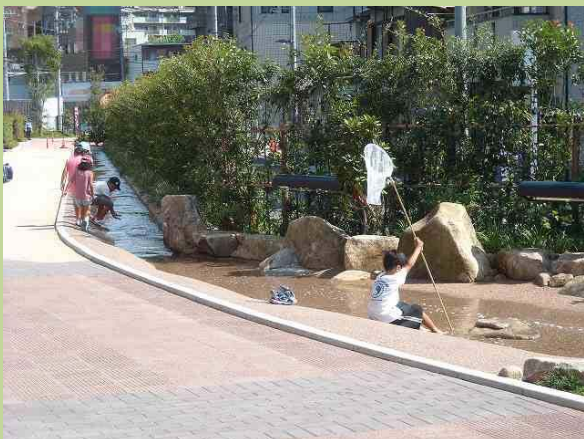
雨水再生水を利用したせせらぎ水路