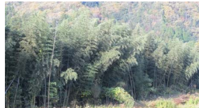
山県郡安芸太田町下筒賀地先