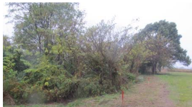
広島市安佐北区口田南地先

② 山県郡安芸太田町下筒賀地先（加計出張所） 15区画 【1区画 幅10m×奥行20～30m程度】