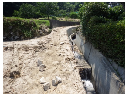
堆積物撤去後の状況