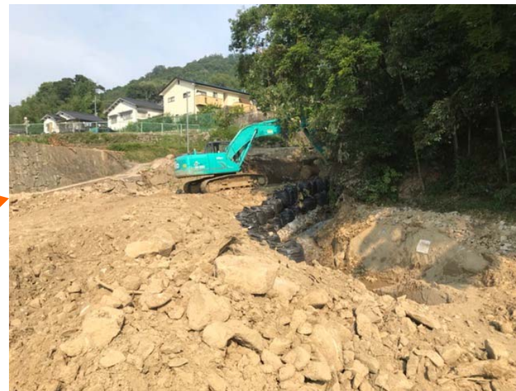
工事用道路の促進