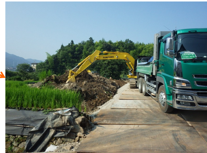
工事用道路(下流部)の促進