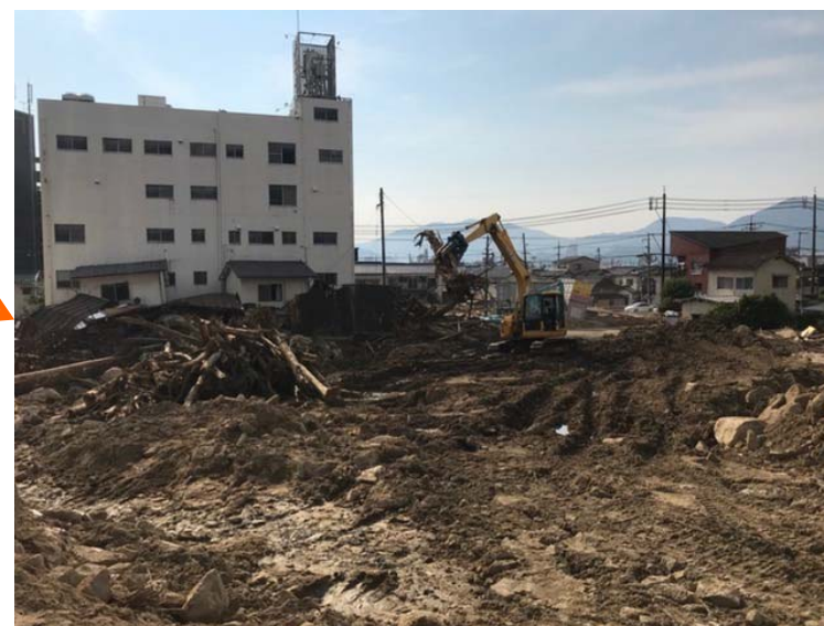
工事用道路入口の堆積物撤去の促進