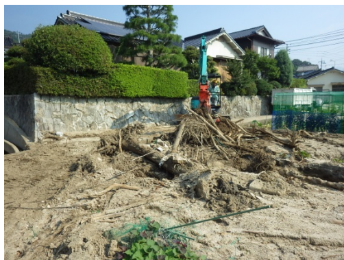
既設排水路の堆積物撤去の促進