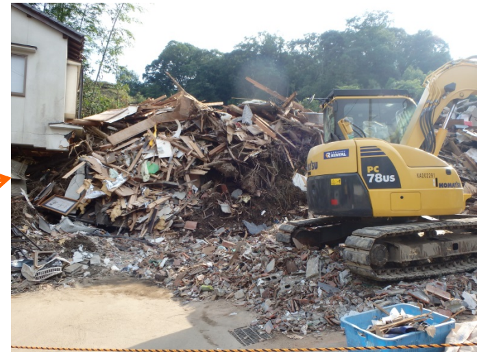
工事用道路(中流部)の促進