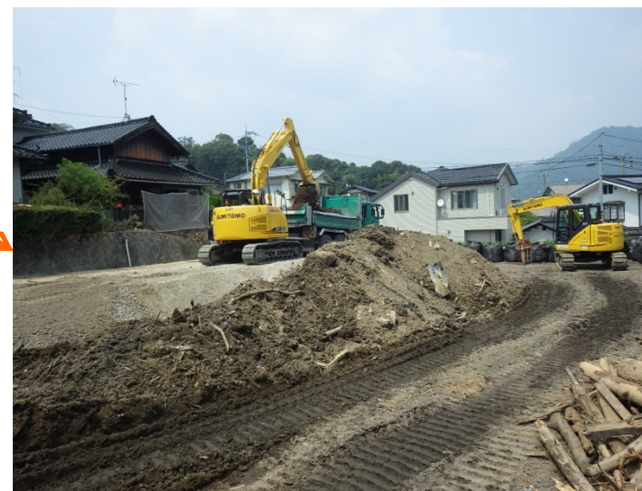
工事用道路(下流部)の延伸