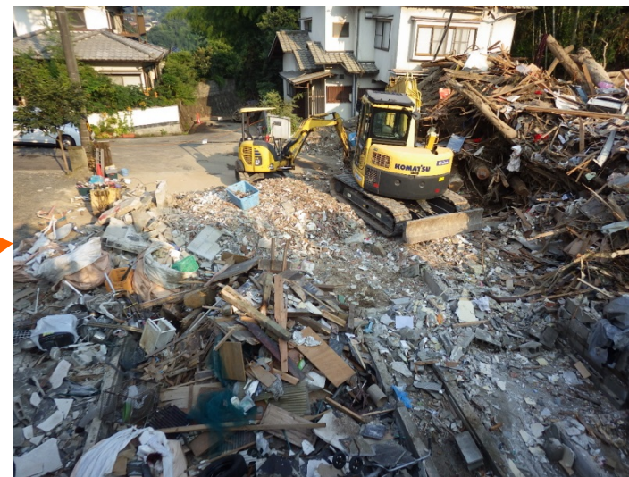
工事用道路(上流部)の延伸 ※)ガレキ撤去を含む