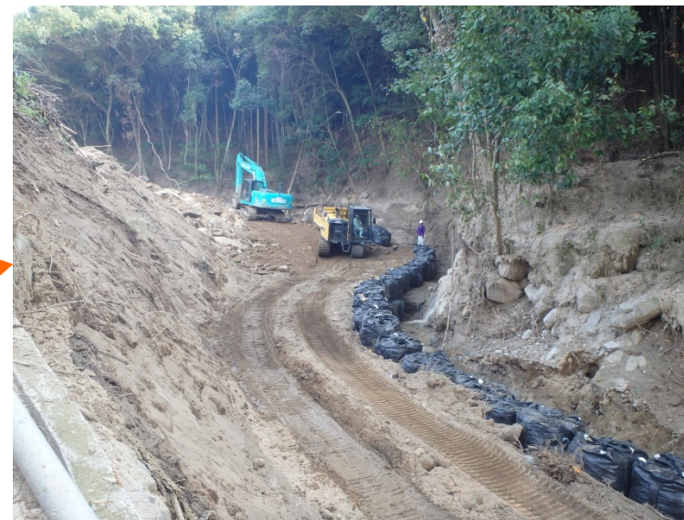
工事用道路の延伸(流路工と兼用)