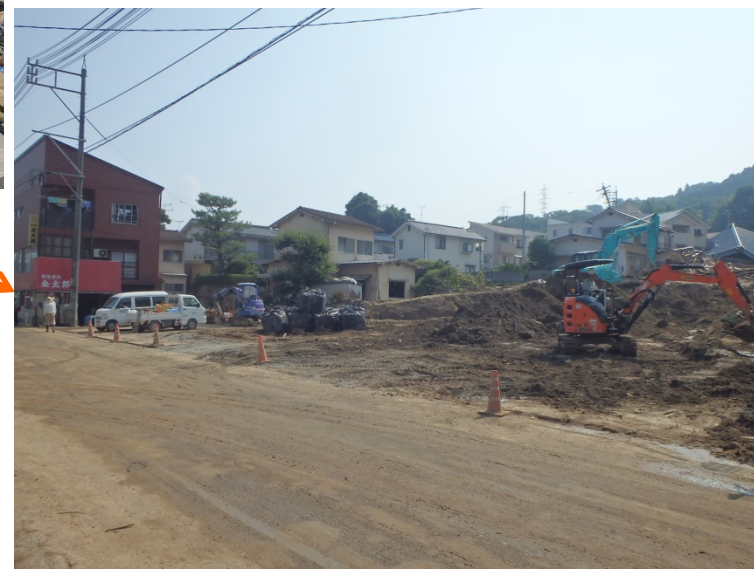
工事用道路入口の堆積物撤去の促進