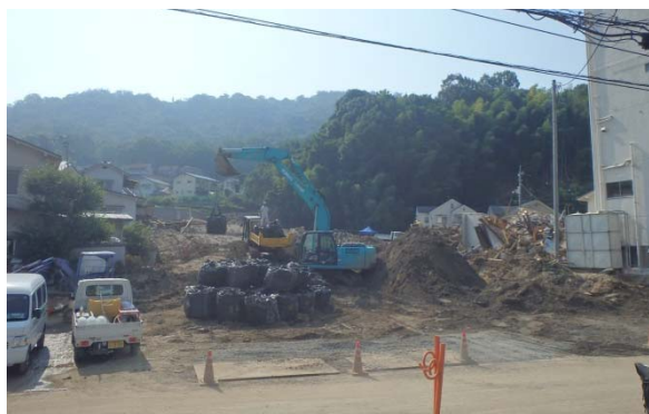
大型土のうの搬入状況