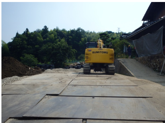
工事用道路の敷鉄板の敷設完了