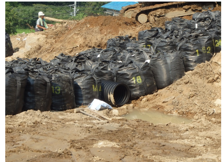
吐出工(導流工)の完成