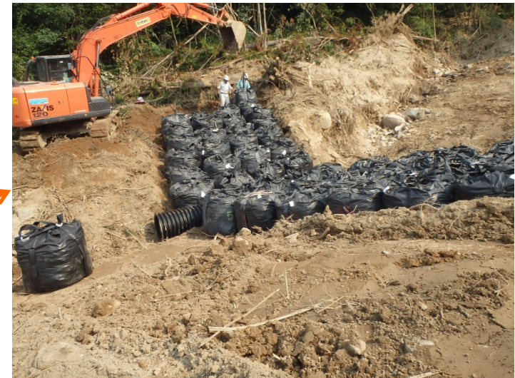
導流工(大型土のう)の促進