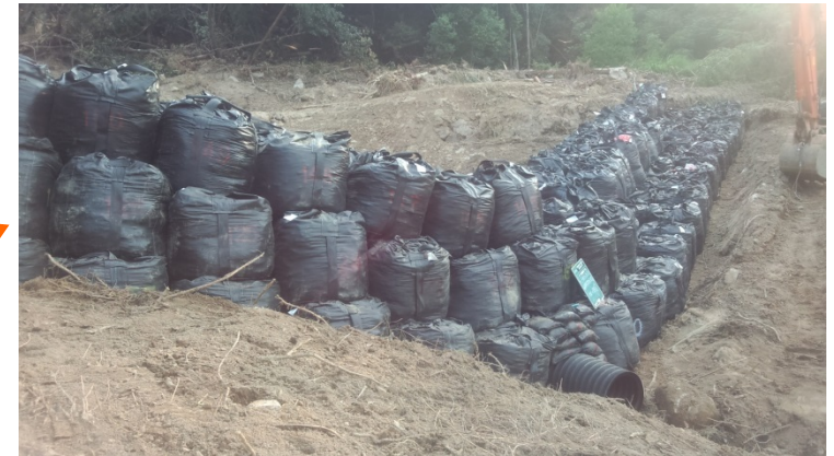
導流工(大型土のう)の促進