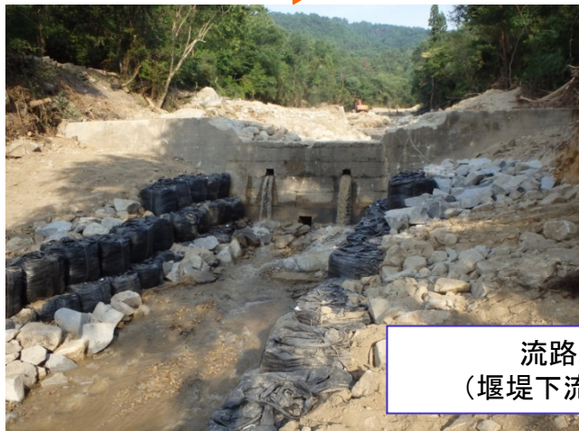
流路工が完成 (堰堤下流の洗掘防止)