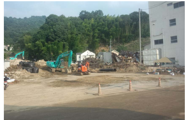
県道からの工事用道路入り口の拡幅