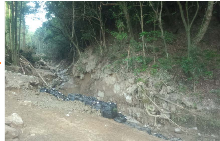
工事用道路の延伸(流路工と兼用)