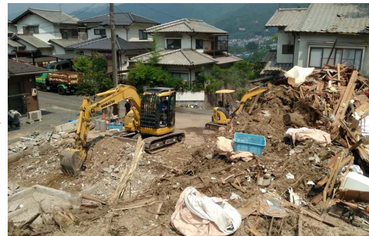
工事用道路(上流部)の延伸 ※)ガレキ撤去を含む