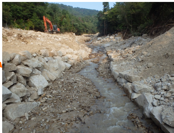
第1堰堤背面の掘削が完了 (流路断面の確保)