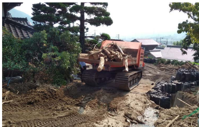
キャリアダンプによる流木処理(溪流内)