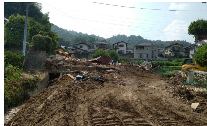
工事用道路(下流部)の延伸