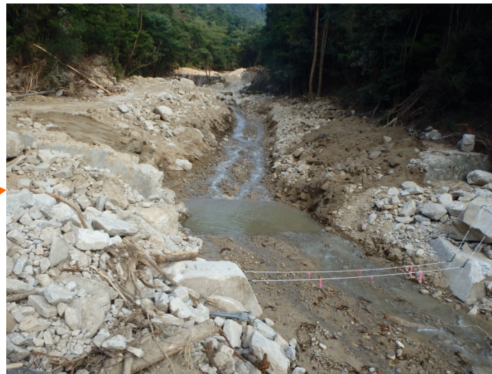
第2堰堤背面の掘削が完了 (流路断面の確保)