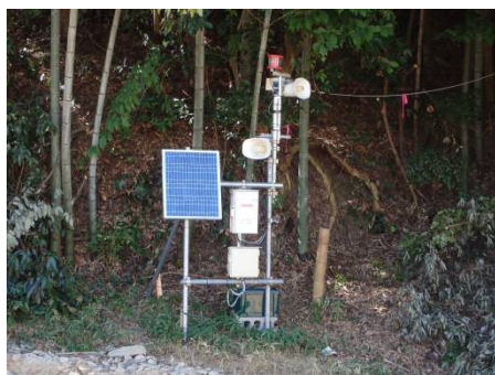
土石流警報装置設置状況