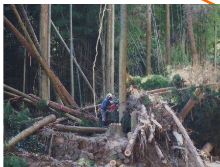
導流工設置付近の伐採状況