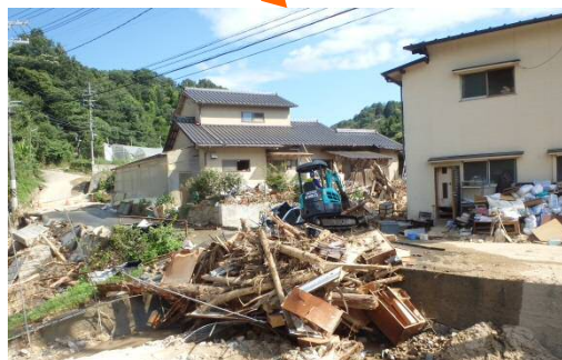
道路及び河道啓開(進入路整備の促進)