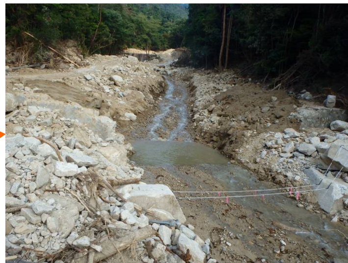
第2堰堤背面の掘削が完了 (流路断面の確保)