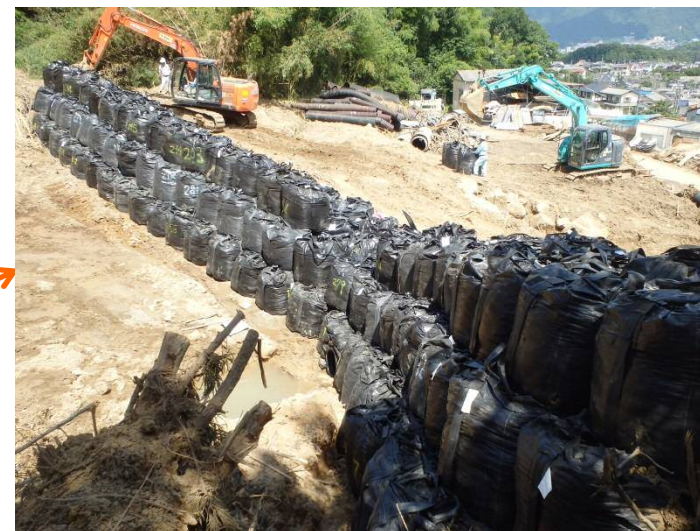
導流工(大型土のう)の促進