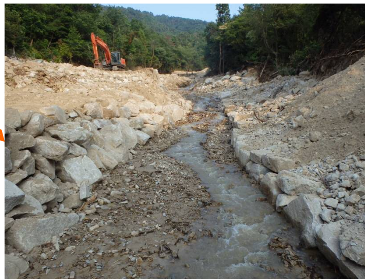
第1堰堤背面の掘削が完了 (流路断面の確保)