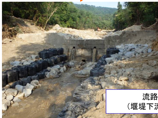
流路工が完成 (堰堤下流の洗掘防止)