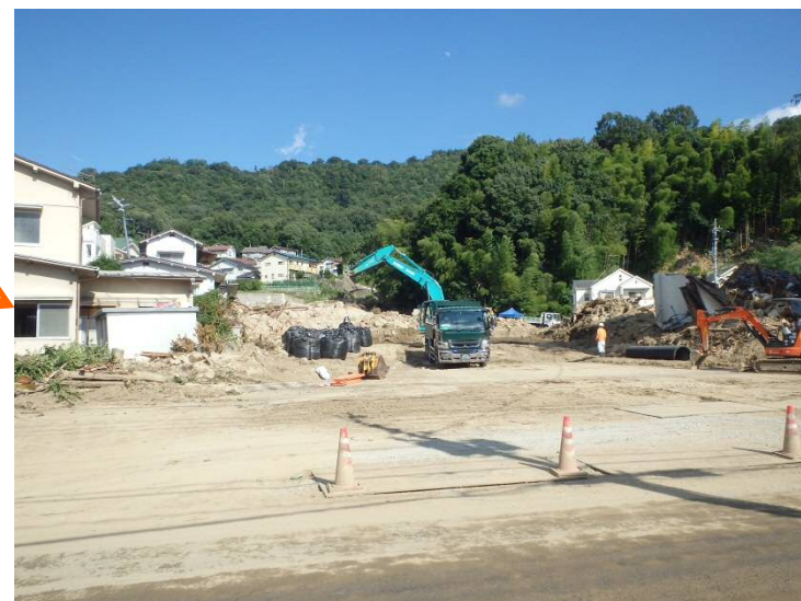
県道からの工事用道路入り口の拡幅