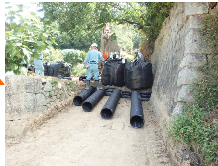
流路工(管渠部の施工状況)の促進