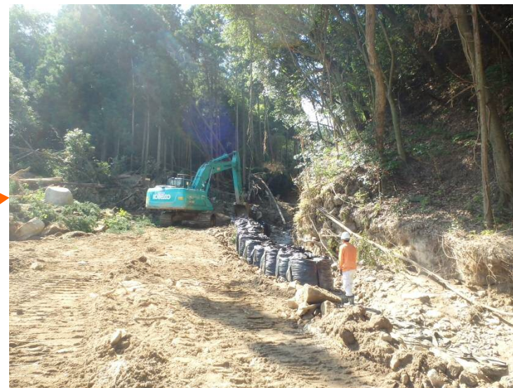
工事用道路の延伸(溪流出口まで到達) (流路工も延伸)