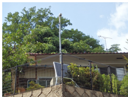
監視カメラ設置完了(7/28)