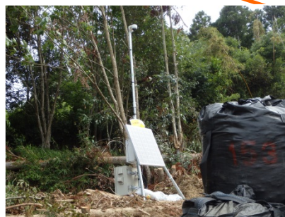
監視カメラ設置完了(7/28)