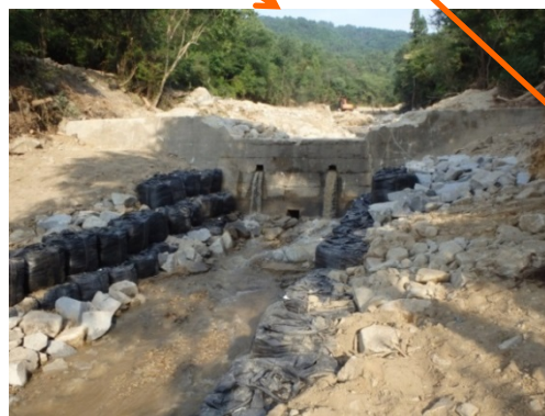
流路工が完成(7/18) (堰堤下流の洗掘防止)