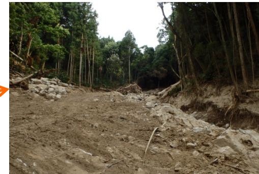
ワイヤーネット進入路整備の促進