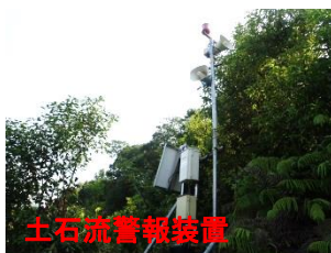
土石流警報装置設置完了(7/19)