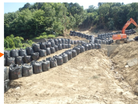
流路工の流路部分が完成(7/24)