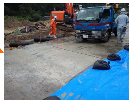
流路工(流末部) 市道横断部の延伸