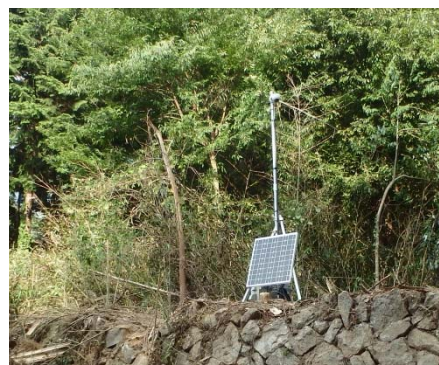
監視カメラ設置完了(7/28)