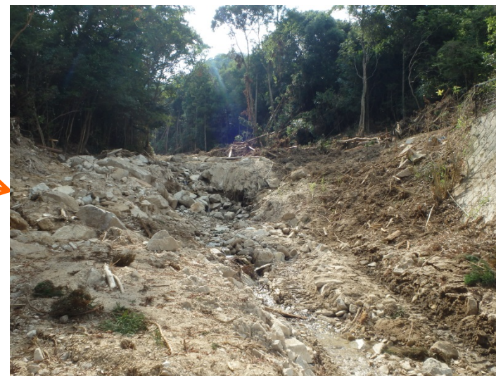
ワイヤーネットの進入路の延伸