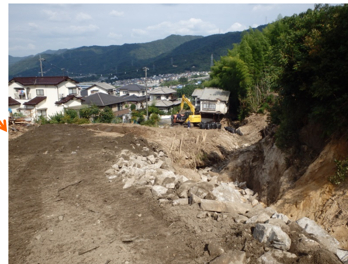
工事用道路の延伸(上流部工事用道路)