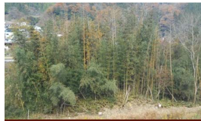
山県郡安芸太田町下筒賀地先