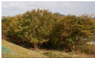
広島市安佐南区八木町地先

伐採場所 ① 広島市安佐南区八木町地先（可部出張所管内） 20区画 【1区画 幅10m×奥行20m程度】 ② 山県郡安芸太田町下筒賀地先（加計出張所管内） 15区画 【1区画 幅10m×奥行20～30m程度】