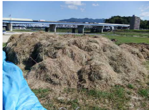
(昨年度の刈草提供状況)