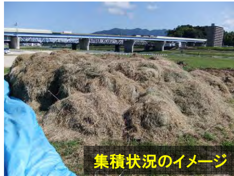
集積状況のイメージ