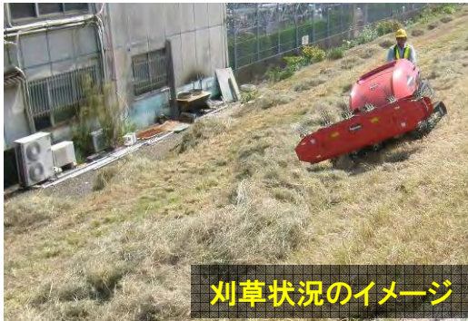
刈草状況のイメージ