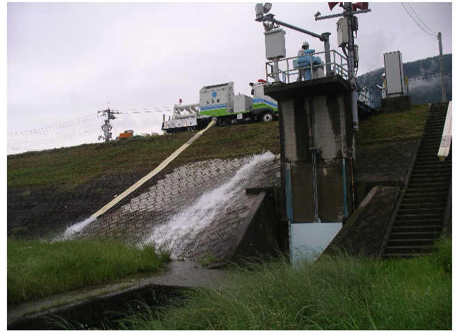
※平成23年度の訓練状況