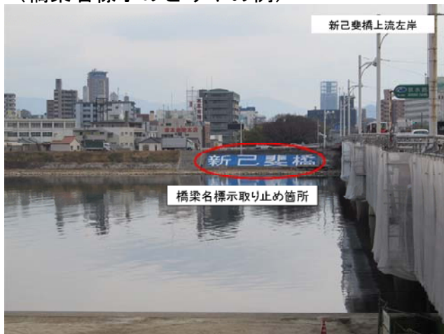
対岸(約300m)からの様子 対空標示文字サイズ 6m×6m