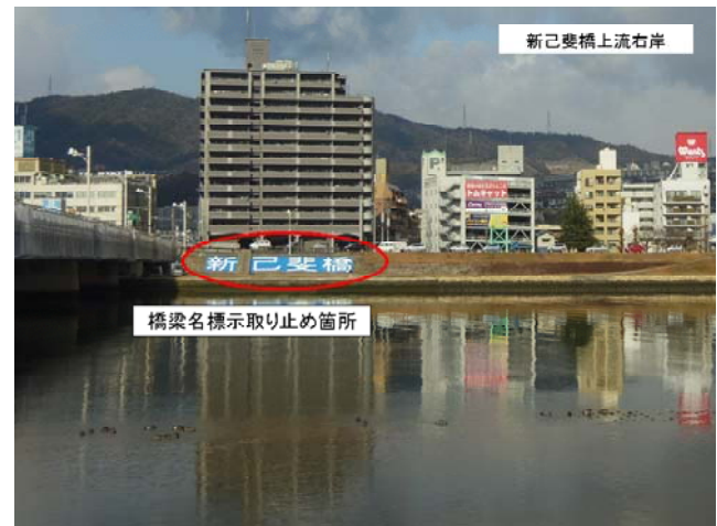
対岸(約300m)からの様子 対空標示文字サイズ 6m×6m