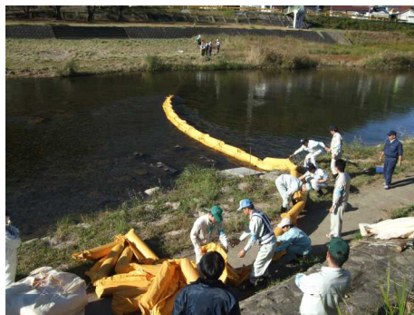
平成23年度の小瀬川の「水質事故訓練」状況

1. 参加機関：国土交通省、広島県、山口県、 広島市、安芸高田市、東広島市、 呉市、江田島市、府中町、岩国市、 廿日市市、大竹市、安芸太田町、 北広島町、和木町、西日本高速道 路（株）