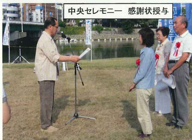
中央セレモニー 感謝状授与