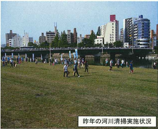
昨年の河川清掃実施状況