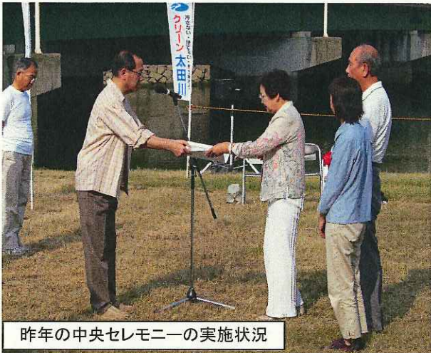
昨年の中央セレモニーの実施状況