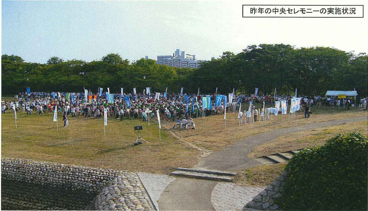
昨年の中央セレモニーの実施状況