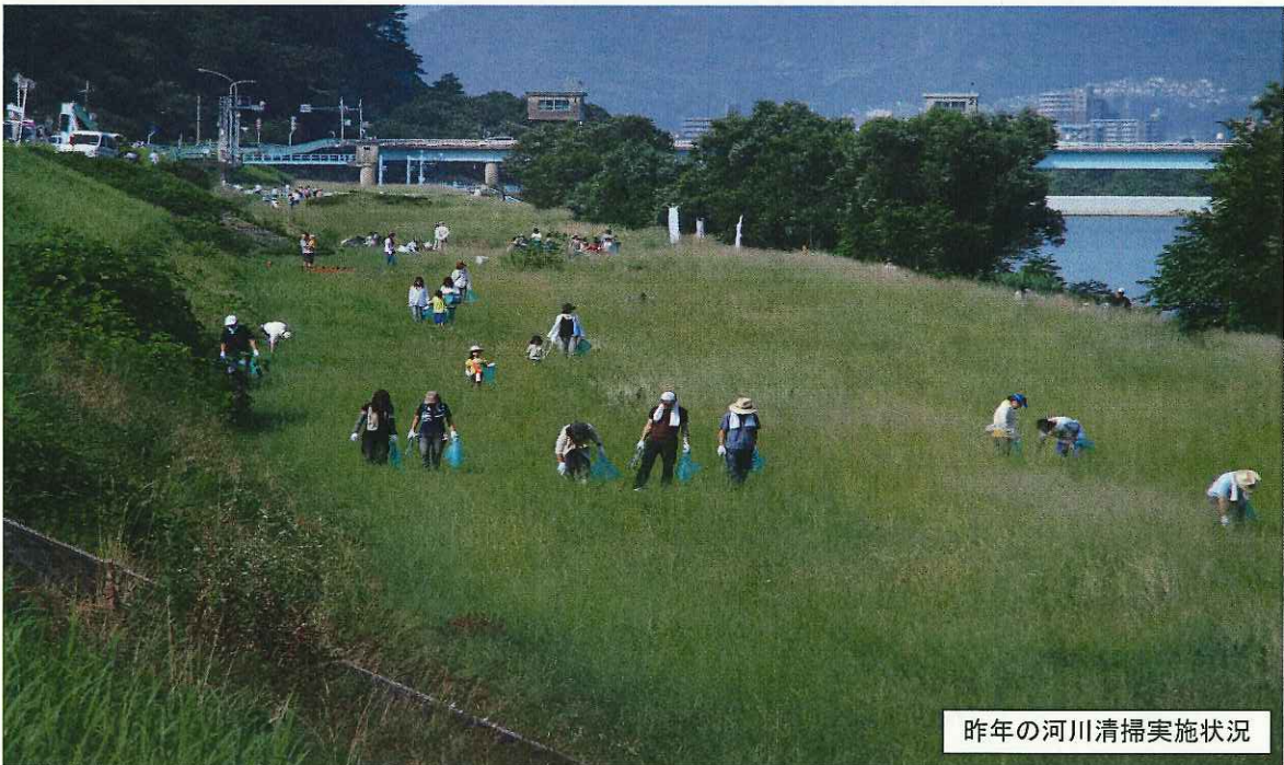
昨年の河川清掃実施状況