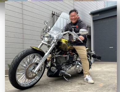
娘のオススメショット!