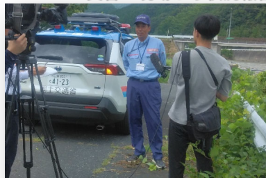
災害の現場から状況報告

今までの経験を活かし、地域の仕事に多く携わることができると思ったため。国土交通省だから挑戦してみました！