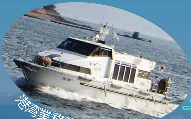
港湾業務艇「りゅうせい」

2/21(火) ①10:30~11:30 2/22(水) ②13:30~14:30 2/24(金) ③15:00~16:00