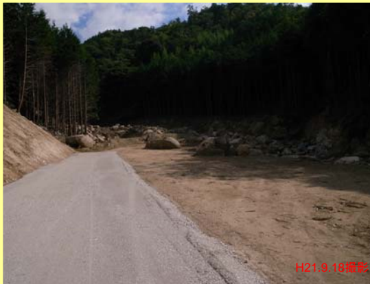
うだみなみがわ ▲上田南川 えん堤予定地付近を下流より望む