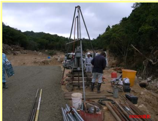
すがわ ▲素川 ボーリング調査状況