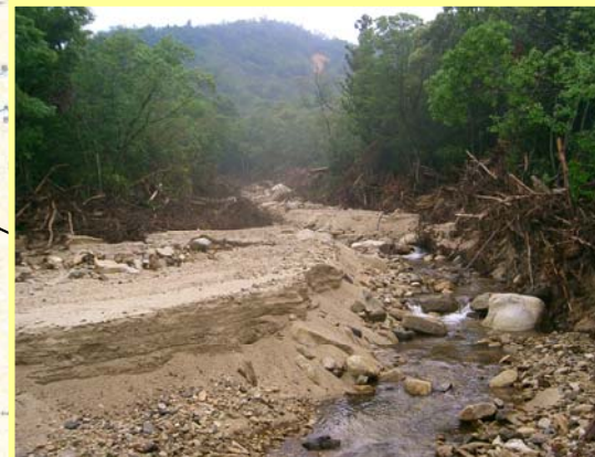
なみがわ ▲奈美川 えん堤予定地付近を下流より望む