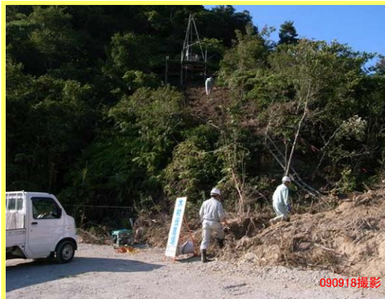
つるぎがわ ▲剣川 ボーリング調査状況