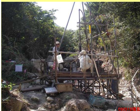
かみさとがわ ▲神里川 ボーリング調査状況