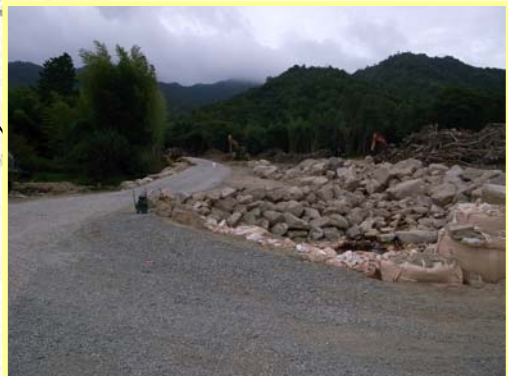
うえだみなみがわ ▲上田南川 進入路完成状況