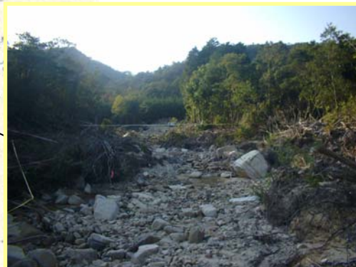
なみがわ ▲奈美川 えん堤予定地付近を下流より望む