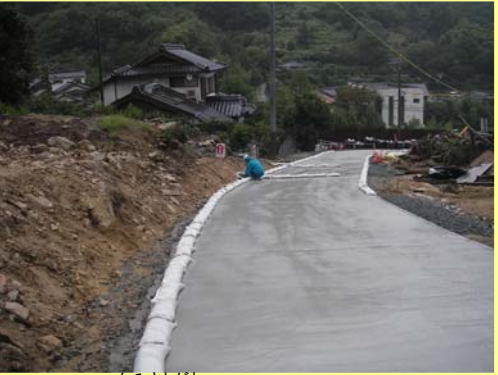
かみさとがわ ▲神里川 進入路完成状況