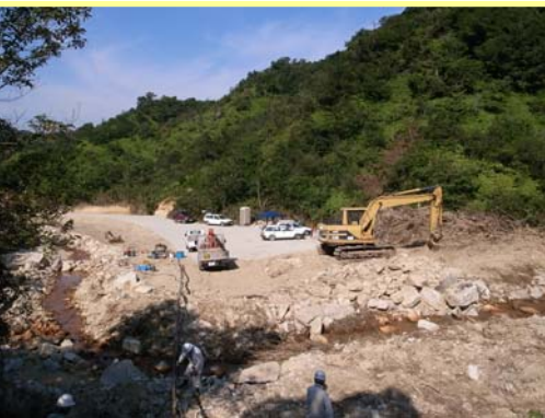
つるぎがわ ▲剣川 えん堤予定地付近を上流より望む