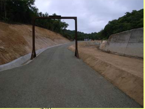
すがわ ▲素川 進入路完成状況