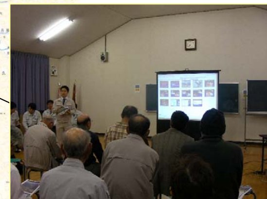
なみがわ ▲奈美川 地元説明会