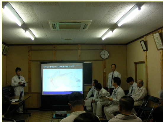
つるぎがわ ▲剣川 地元説明会