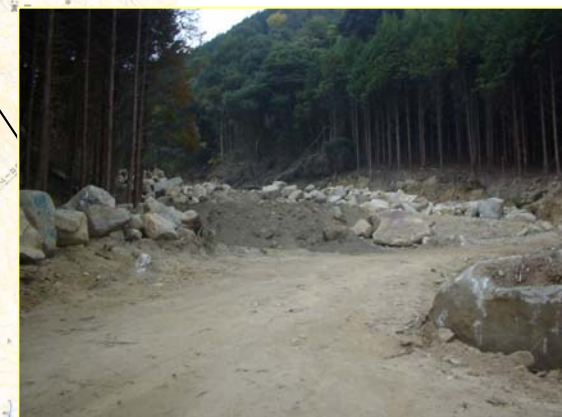
うだみなみがわ ▲上田南川 えん堤予定地付近を下流より望む