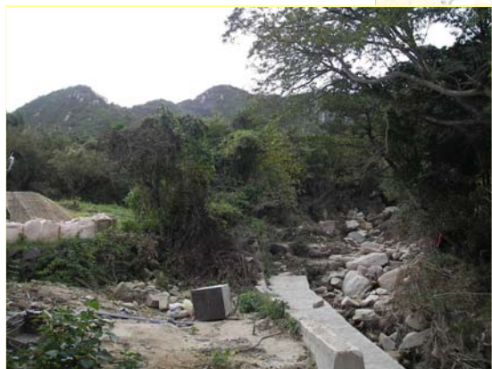
かみさとがわ ▲神里川 えん堤予定地付近を下流より望む