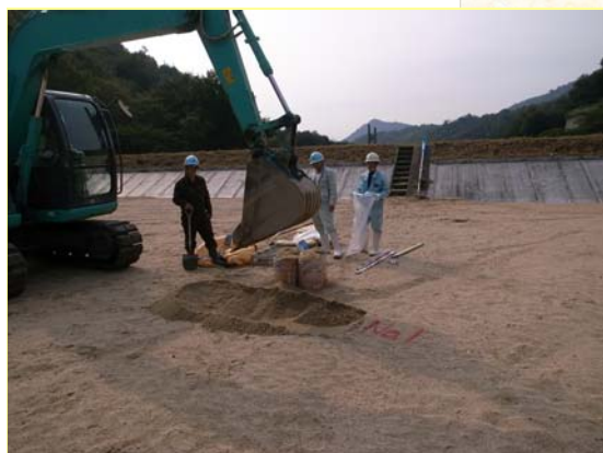
すがわ ▲素川 ソイルセメント試料採取状況