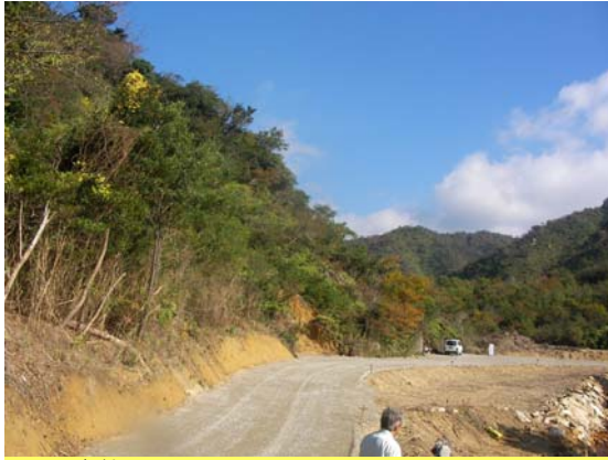
つるぎがわ ▲剣川 えん堤予定地付近を下流より望む