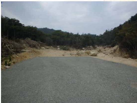
すがわ ▲素川 えん堤予定地付近を下流より望む