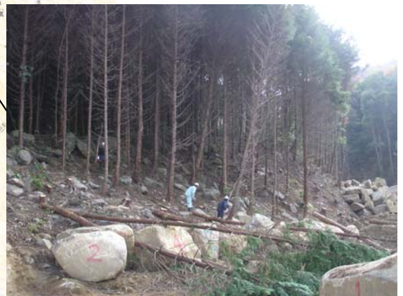
うえだみなみがわ ▲上田南川 伐採状況