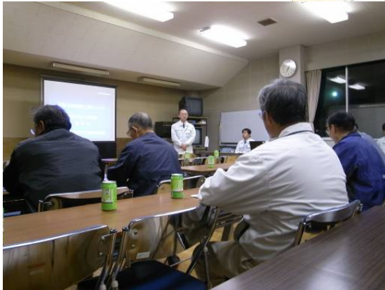
かみさとがわ ▲神里川 地元説明会