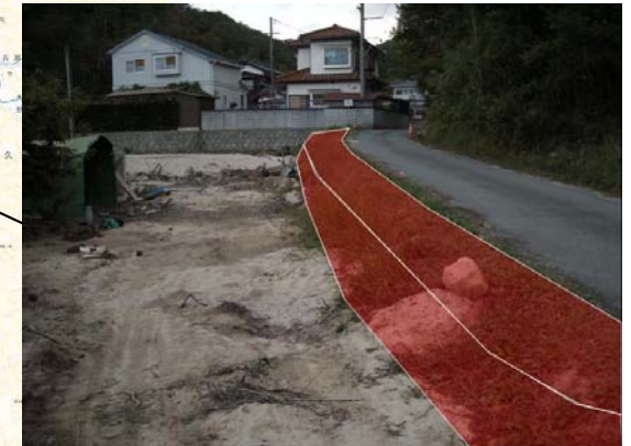
なみがわ ▲奈美川 進入路拡幅予定箇所