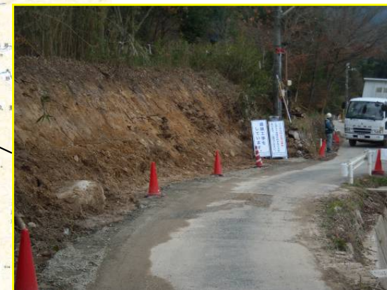
なみがわ ▲奈美川 現道拡幅状況