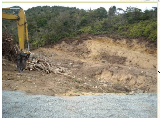
かみさとがわ ▲神里川 伐採状況