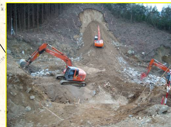
うえだみなみがわ ▲上田南川 掘削状況