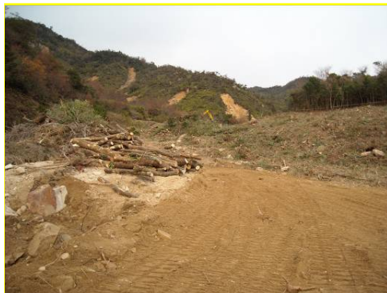
つるぎがわ ▲剣川 伐採状況