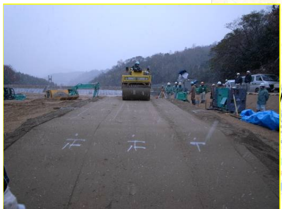
すがわ ▲素川 ソイルセメント試験施工