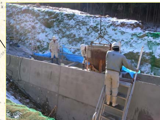
うえだみなみがわ ▲上田南川 コンクリート打設状況