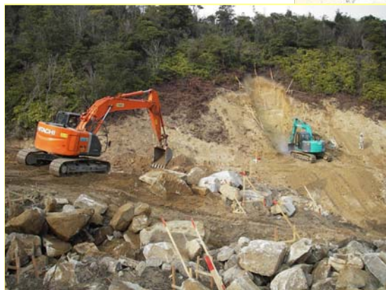
かみさとがわ ▲神里川 掘削状況