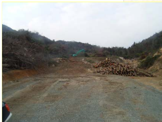
すがわ ▲素川 伐採状況