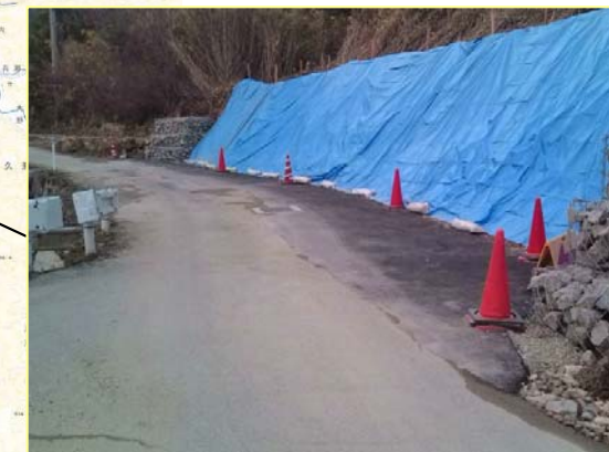
なみがわ ▲奈美川 現道拡幅状況