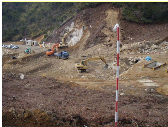
つるぎがわ ▲剣川 掘削状況