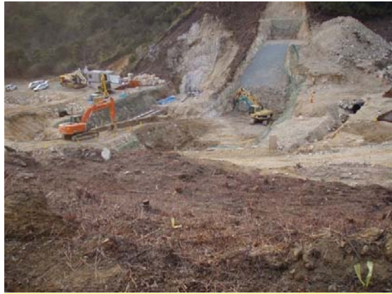
つるぎがわ ▲剣川 掘削状況