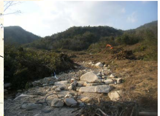
なみがわ ▲奈美川 伐採状況