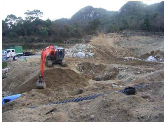
かみさとがわ ▲神里川 掘削状況