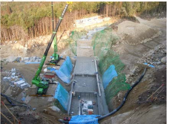
うえだみなみがわ ▲上田南川 コンクリート打設状況