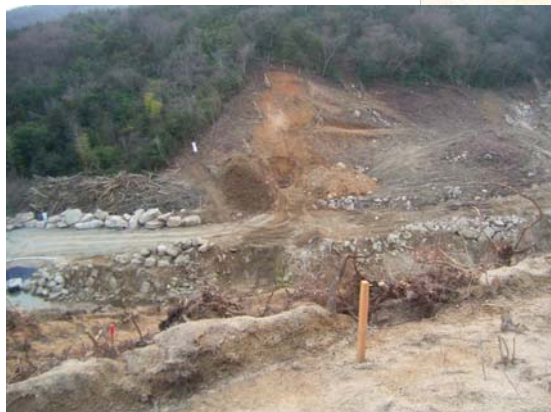
すがわ ▲素川 掘削状況