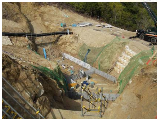
かみさとがわ ▲神里川 型枠設置状況