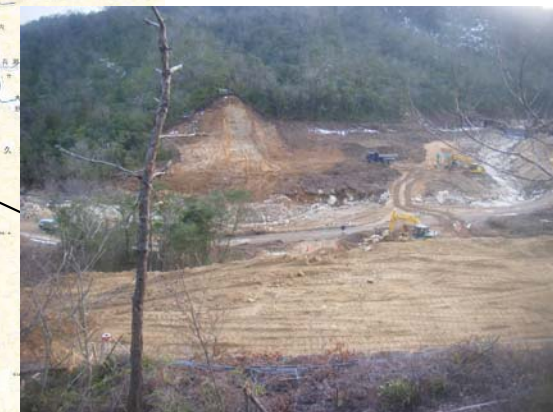
なみがわ ▲奈美川 掘削状況