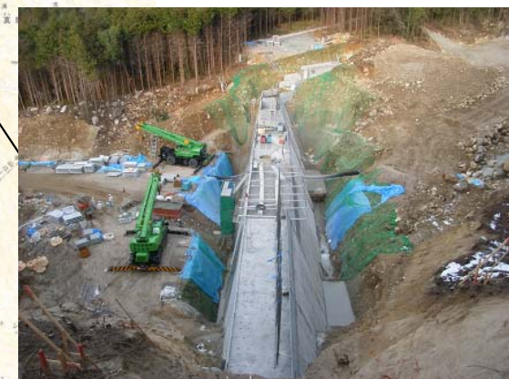
うえだみなみがわ ▲上田南川 コンクリート打設状況