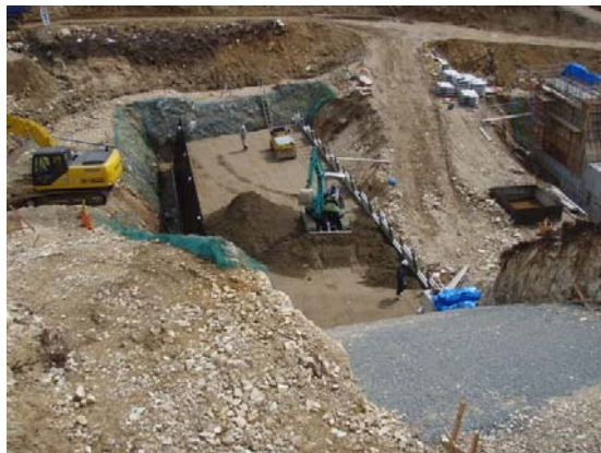
つるぎがわ ▲剣川 ソイルセメント打設状況