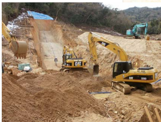
すがわ ▲素川 掘削状況