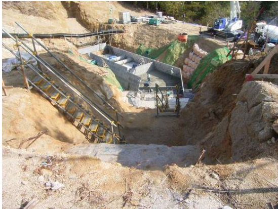
かみさとがわ ▲神里川 コンクリート打設状況