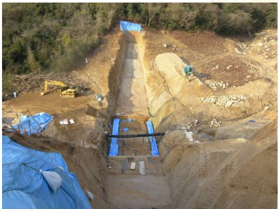
すがわ ▲素川 基礎コンクリート打設状況