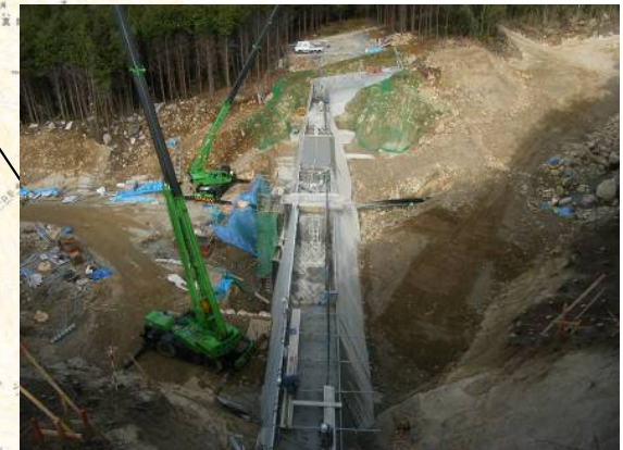
うえだみなみがわ ▲上田南川 コンクリート打設状況