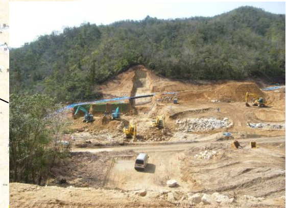
なみがわ ▲奈美川 掘削状況