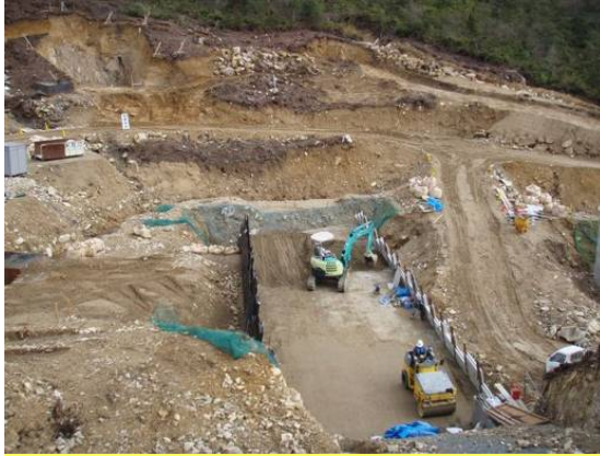
つるぎがわ ▲剣川 ソイルセメント打設状況