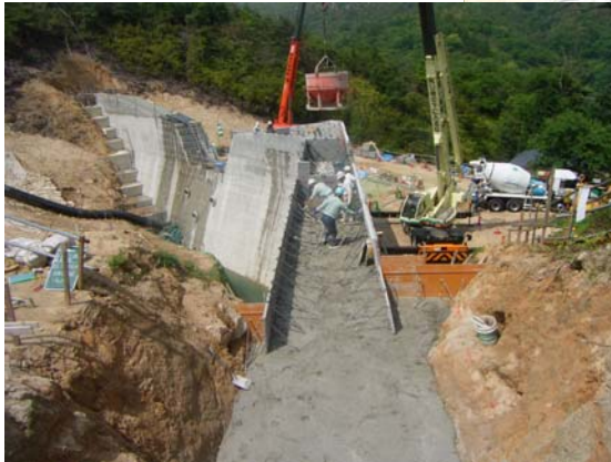
かみさとがわ ▲神里川 コンクリート打設状況