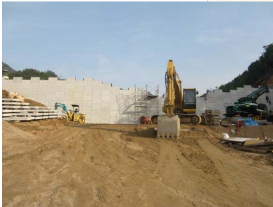
すがわ ▲素川 ソイルセメント打設状況