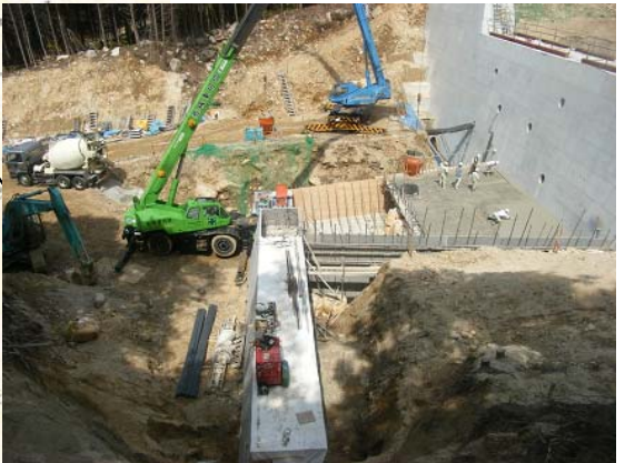
うえだみなみがわ ▲上田南川 コンクリート打設状況(垂直壁)