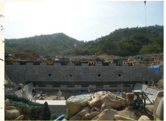
なみがわ ▲奈美川 ソイルセメント打設状況