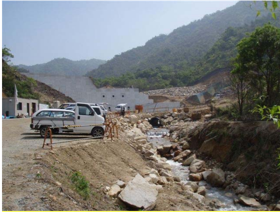
つるぎがわ ▲剣川 ソイルセメント打設状況