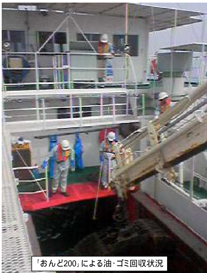
「おんど200」による油・ゴミ回収状況