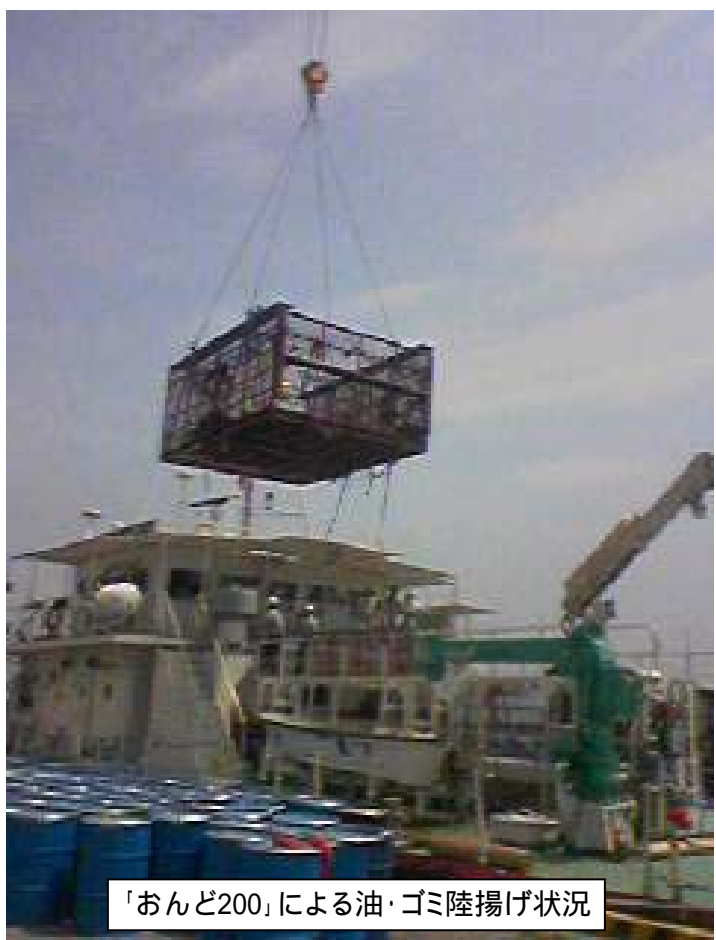
「おんど200」による油・ゴミ陸揚げ状況