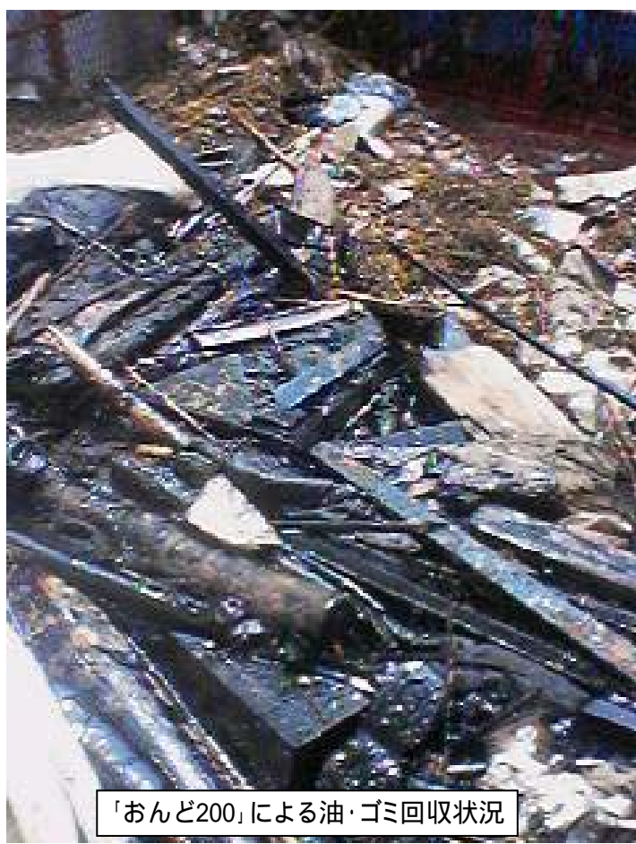
「おんど200」による油・ゴミ回収状況