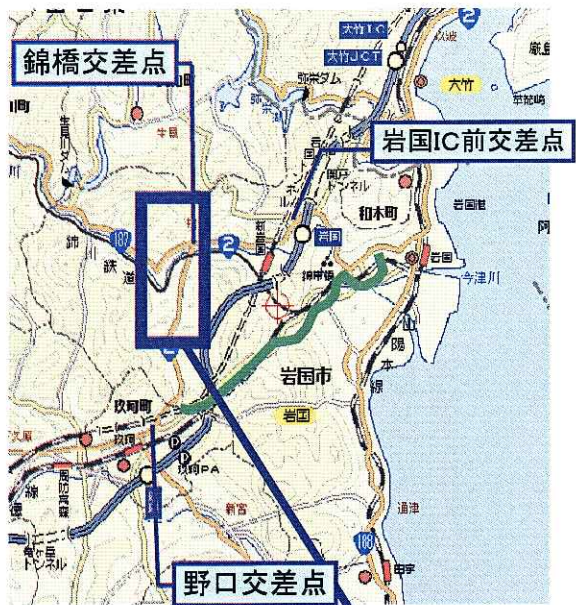
山口県岩国市付近 平面図