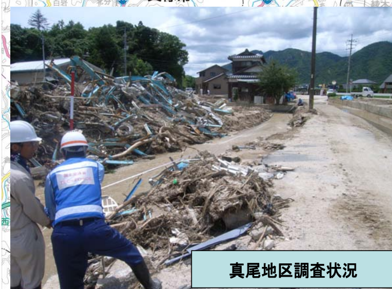
真尾地区調査状況