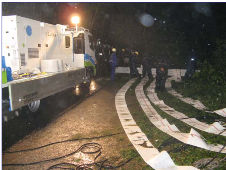
▲ 排水ポンプ車設営状況(7/26)