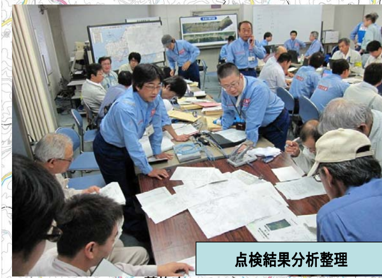
点検結果分析整理