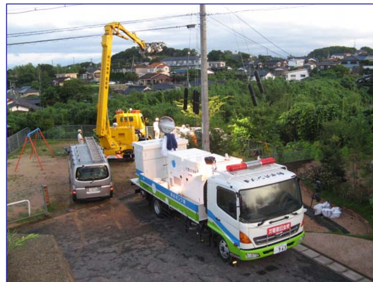
▲ 排水ポンプ車と照明車(7/27)