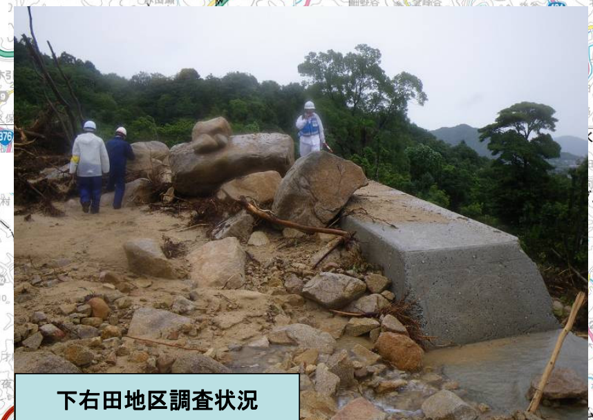
下右田地区調査状況