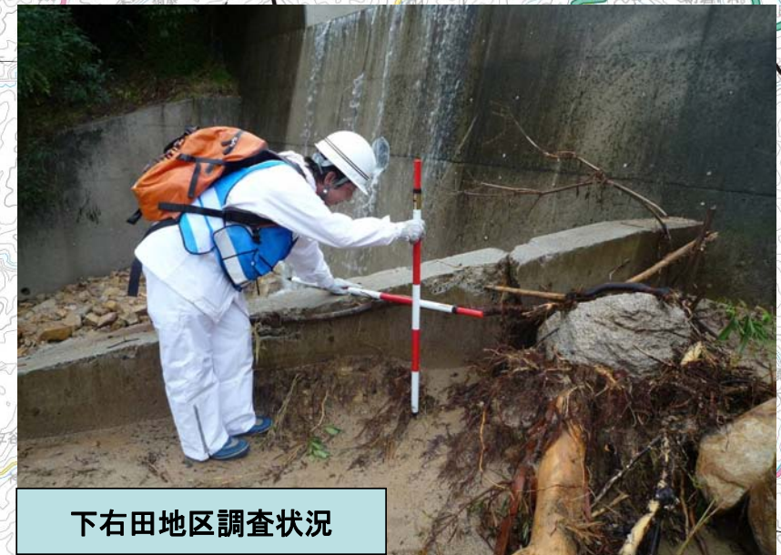
下右田地区調査状況