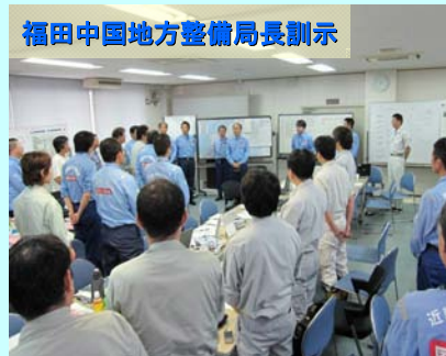
7/26 TEC-FORCE 隊員調査状況