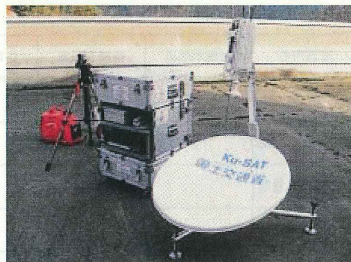
衛星小型画像伝送装置 (Ku-SAT)