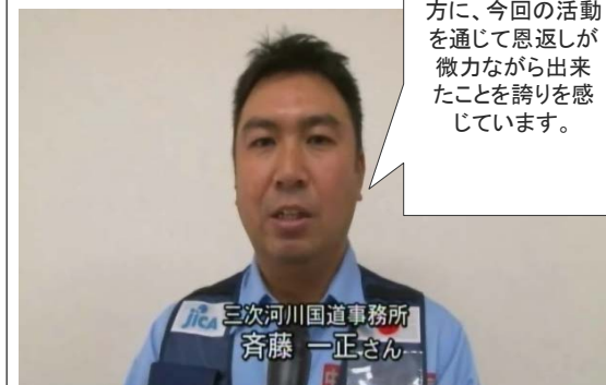
三次ケーブルテレビ 1/11(水)17:30~(約2分半)

東日本大震災の時に大きな支援をいただいたタイの方に、今回の活動を通じて恩返しを微力ながら出来たことを誇りを感じています。