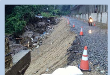
(主)萩津和野線(津和野町鷺原) 通行不能 8月2日 7:00撮影