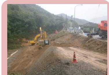
国道191号(萩市須佐) 通行不能 8月2日 7:00撮影