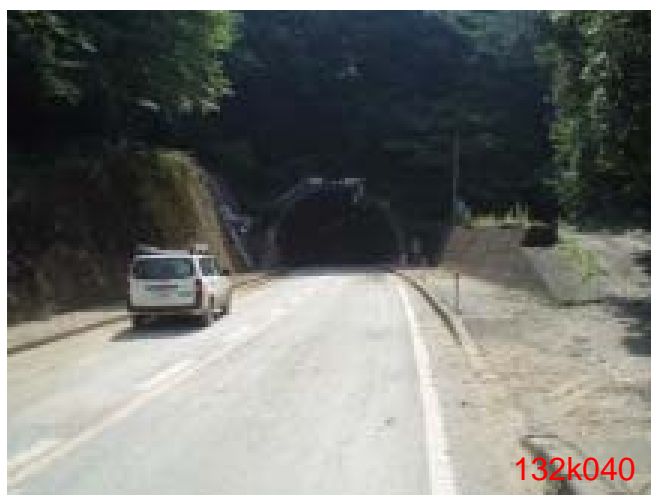
土砂流出:上下線通行止め(大刈トンネル)