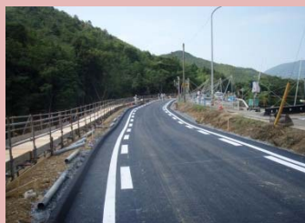
国道191号(萩市須佐) 通行可能 (8月4日 16:00撮影)