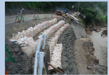
(主)萩津和野線(津和野町高峯) 通行不能 8月2日 16:00撮影