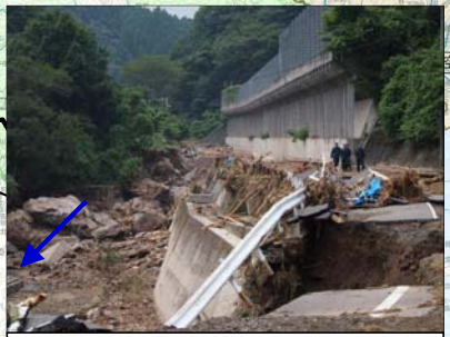
⑨島根県 高津川水系名賀川 ※高津川水防センターより、袋詰玉石120袋提供