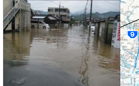
②山口県 榎野川水系前田川