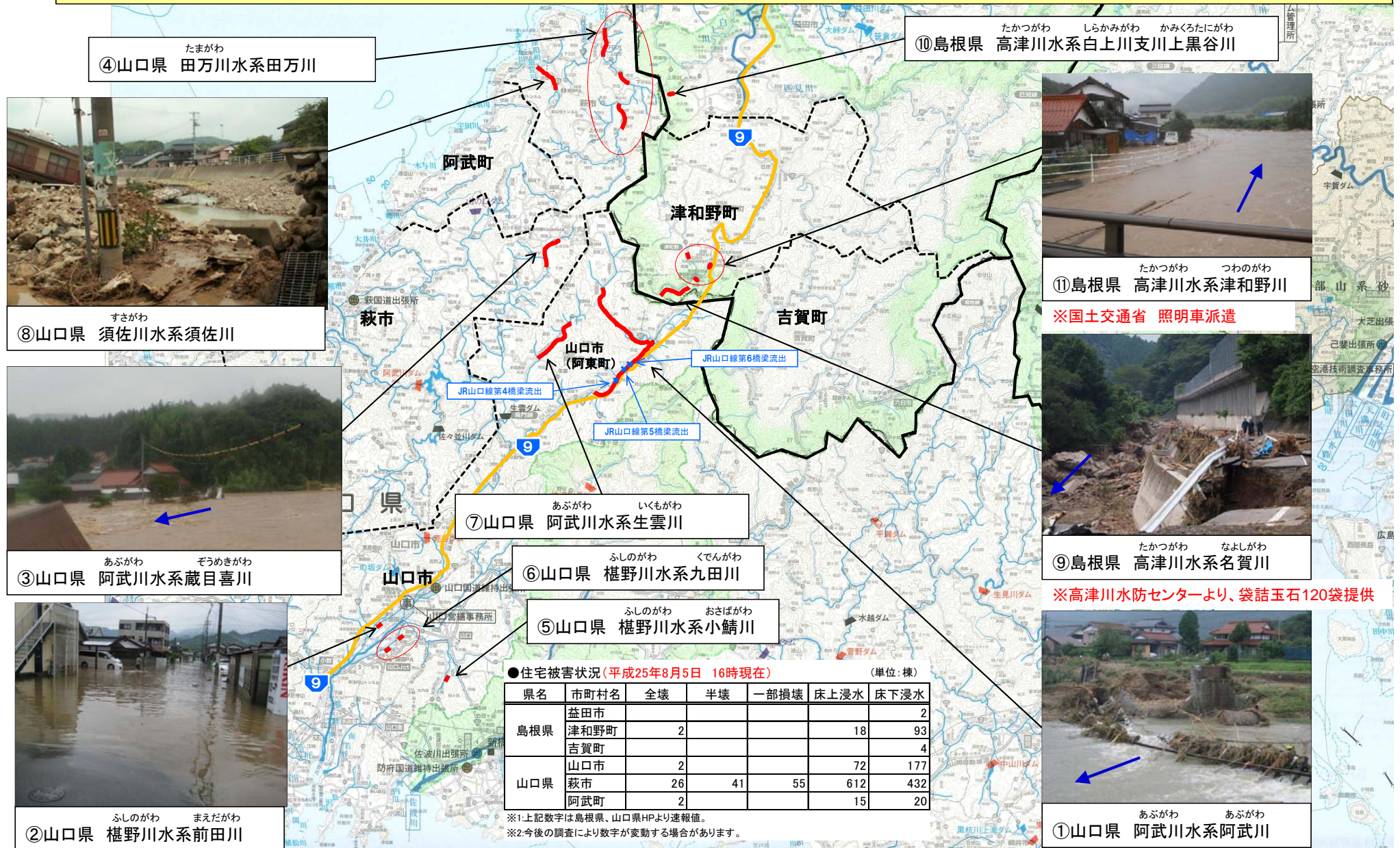
④山口県 田万川水系田万川

島根県: 津和野川外(津和野町)で床上浸水18棟、床下浸水93棟、全壊2棟。福川川外(吉賀町)で床下浸水4棟。上黒谷川(益田市)で床下浸水2棟。