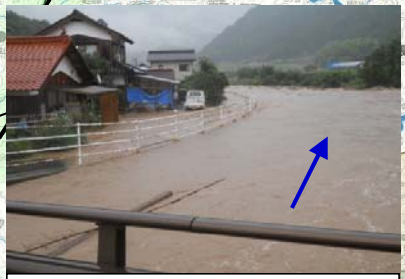
⑪島根県 高津川水系津和野川 ※国土交通省 照明車派遣