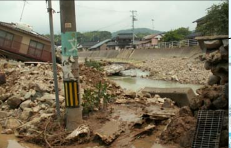
⑧山口県 須佐川水系須佐川