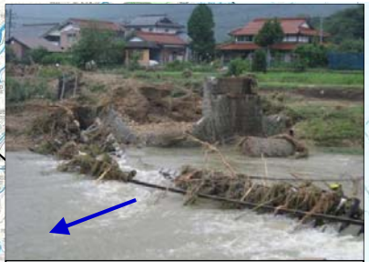
①山口県 阿武川水系阿武川