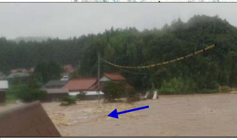
③山口県 阿武川水系蔵目喜川