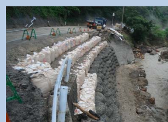
(主)萩津和野線(津和野町高峯) 通行不能 8月2日 16:00撮影